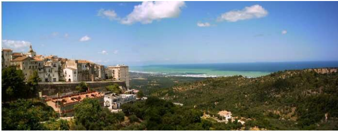
Visuale di Ischitella, nel Gargano